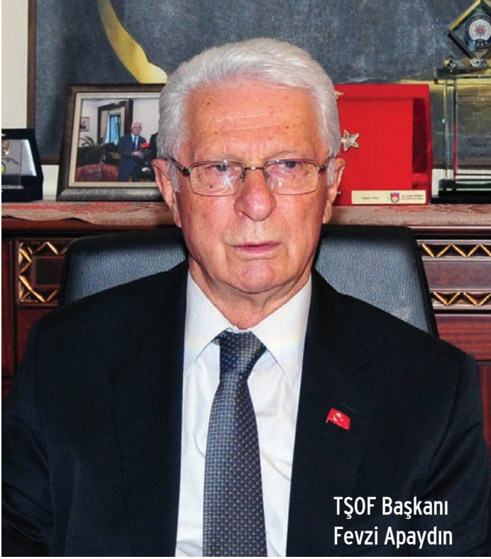
TŞOF Başkanı Fevzi Apaydın