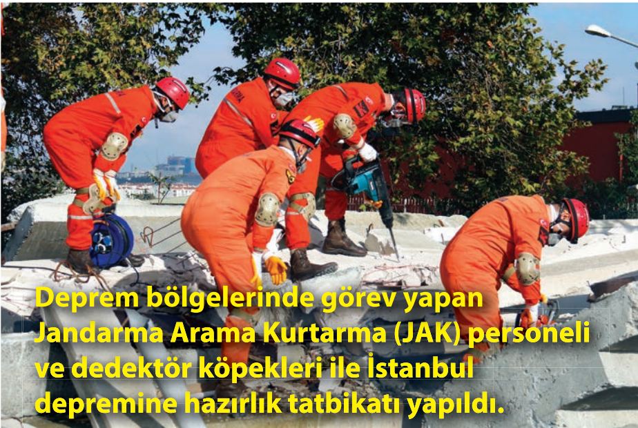
Deprem bölgelerinde görev yapan Jandarma Arama Kurtarma (JAK) personeli ve dedektör köpekleri ile İstanbul depremine hazırlık tatbikatı yapıldı.

Doğal afetlerin her zaman olacağını ancak önemli olanın buna en hazır şekilde yakalanmak olduğunu kaydeden Soylu, "Milletçe odaklanmamız gereken mesele şudur; tüm hazırlık ve birikimleri 2-3 katına da çıkarsak tamam diyebileceğimiz bir nokta olmayacaktır. Çünkü afet dediğimiz bir noktada bitebilecek ve sıfırlanabilecek bir süreç değildir. Terör bitebilir. Kaynağı var kurutursunuz. Hırsızlığı, uyuşturucuyu, trafik kazalarını en alt seviyelere indirebilirsiniz ki, indirmek için çaba sarf ediyoruz. Ancak bir daha deprem olmayacağını kimseye söyleyemeyiz. İllaki olacak. Zamanı kimsenin kestirebilmesi mümkün değil. Depremler de, seller de, hortumlar da, başka doğa olayları da devam edecektir. Dolayısıyla sürekli hazırlanmak, sürekli afet yönetim kapasitemizi yenilemek ama en önemlisi de bu afetlere dayanıklı yıkılmayan, zarar görmeyen yaşam alanları oluşturmak, doğa ne diyorsa onu yapmak zorundayız" ifadelerini kullandı.