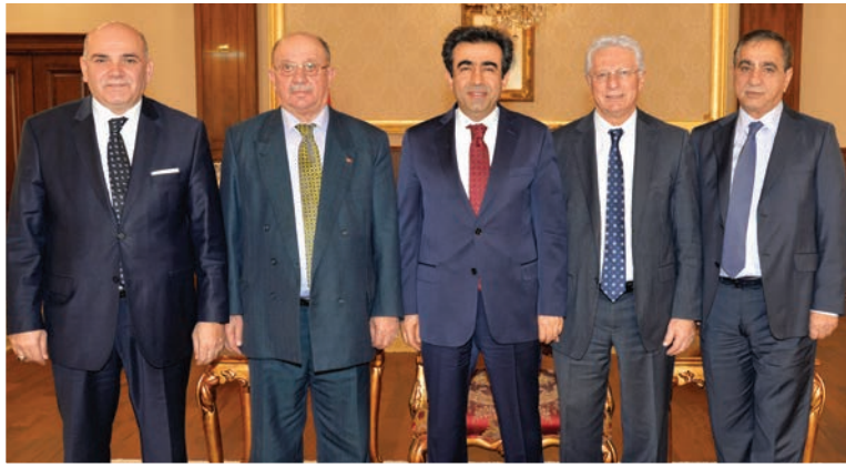
Türkiye Şoförler ve Otomobilciler Federasyonu Başkanı ve oda başkanları Kocaeli Valisi Hasan Basri Güzeloğlu'nu ziyaret ettiler

Türkiye Şoförler ve Otomobilciler Federasyonu (TŞOF) Başkanı Fevzi Apaydın, TŞOF Başkan Vekili ve Mersin Şoförler ve Otomobilciler Esnaf Odası Başkanı Veysel Sarı, Kocaeli Şoförler ve Otomobilciler Esnaf Odası Başkanı Kemal Kaya ve Kocaeli Esnaf Odaları Birliği Başkanı Kadir Durmuş ile birlikte Kocaeli Valisi Hasan Basri Güzeloğlu'nu makamında ziyaret ettiler.