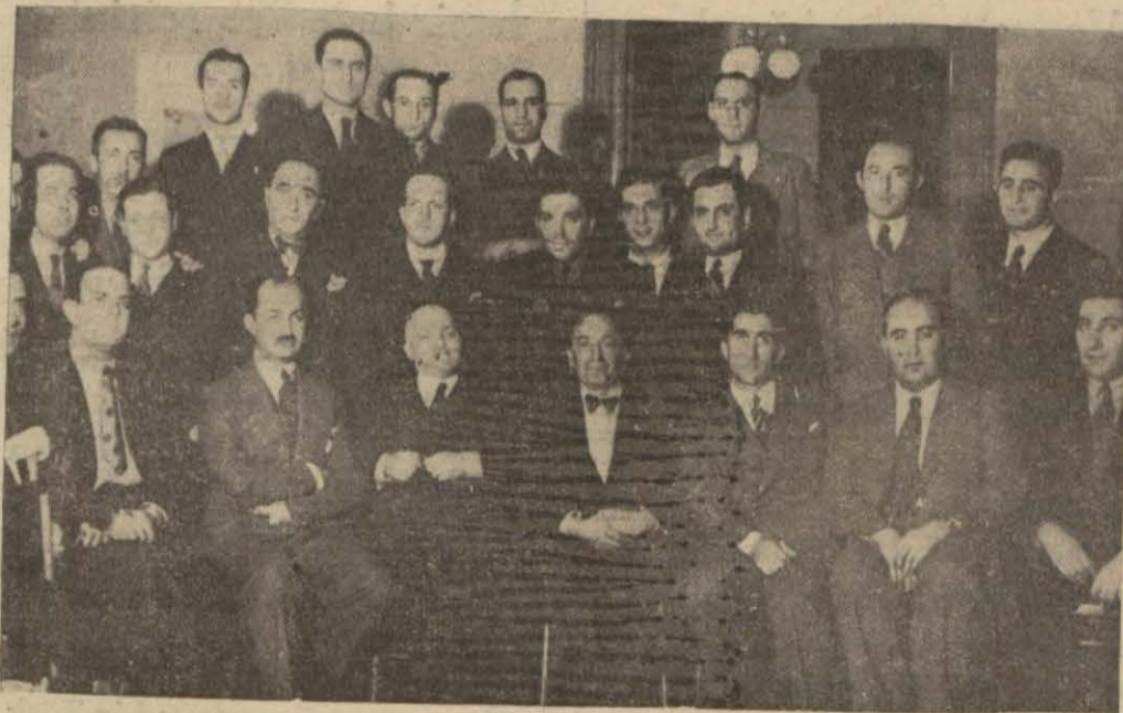
Galatasaraylıların dünkü toplantısında bulunanlardan bir grup

Bir kaç nutuktan sonra büyüklere bir telgraf çekilmesine karar verildi