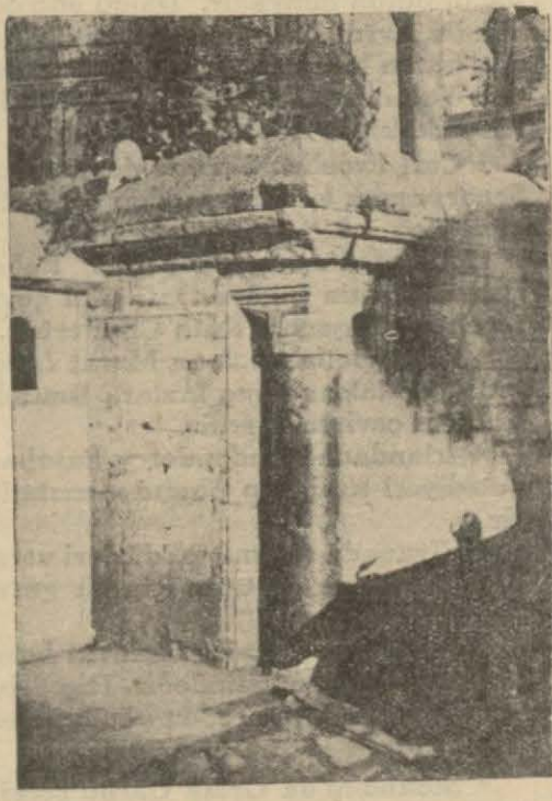
Şehzadebaşında Feyziye caddesi gerisinde İstanbulun ortasını gösteren mermer direk

Nihayet, Şehzade Camiinden Vefa'ya çıkan caddenin köşesinde bir kalabalık gözüme ilişti. Aralarına