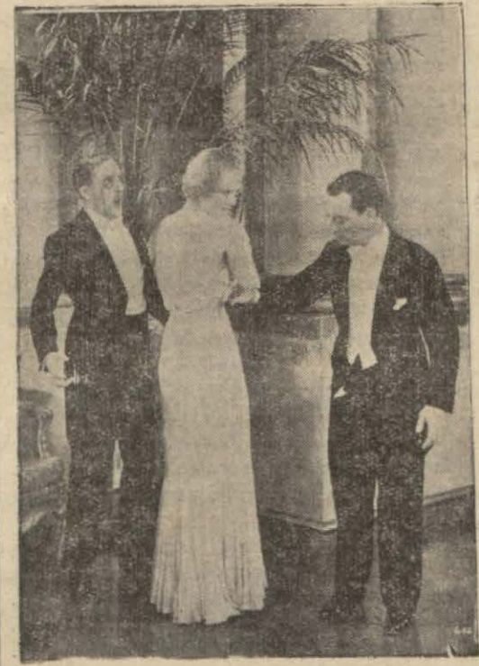
(Aşk Çilingir) filminden

Bu film, garip filmler arasında dik-kate sayan bir eser teşkil eder. Bir delinin fen dehâsile neler yaptığını göstermesi itibarile dehşetli bir şeydir. Türkçeleştirilmiş olan bu filmde türkçe dili biraz garip geliyor. Eğer mevzu uygun seslere malik adamlar bulunsaydı, belki muvaffak addedilebilirdi. Bize kalırsa türkçeleştirilecek filmlerin hususî bir çehresi olmaması şayanıdır.