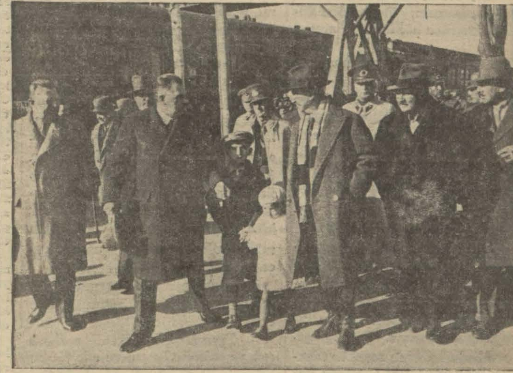
Kıymetli bir intiba: İsmet Paşa Hz. Ankara istasyonunda karşılanıyorlar

BERLİN, 23. A. A. — İntihabat neticesini tetkik komisyonu işini bitirmiştir. 12-11 intihabat neticesi şudur: Kaydedilen müntheipler: 45,176,813. Rey âme iştirak edenler: 43,491,575. Evet: 40,632,628 nispet yüzde 96,1. Hayır: 2,101,191 nispet yüzde 4,9. Hükümsüz rey varakaları: 757,756. Reichstag intihabâtı: Müntheipler: 43,053,616. Nazi hükümet listesi: 39,660,212. Hükümsüz rey varakaları: 3,398,404. Seçilen mebus adedi 661