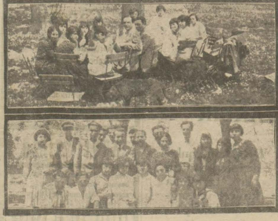
Mekteplerin tatil devresi geldiğinden bütün mektepler tedezzül yapmaktadırlar. Alman İleside dün Trabzyaya Alman sefarethanesine giderek bir gezinti tertip etmişlerdir. Talebeler muhtelif eğlenceler yapıyorlar ve Alman sefiri Hz. bir nutuk söylemiştir. Alman mektebi talebesinden iki grup.