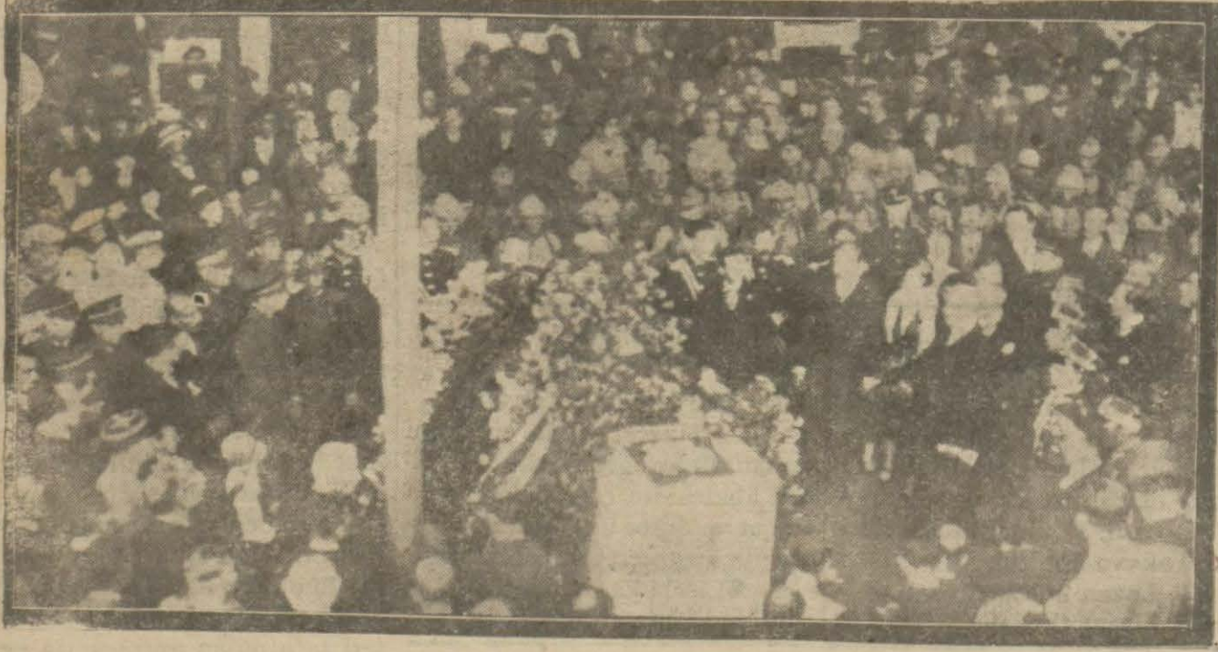
Lehistan heyeti dün polonyalı Murat paşanın kemiklerini Halepten şehrimize getirmişlerdir. Dün akşam bu münasebetle Sirkeci İstasyonunda büyük merasim yapılmıştır. İstasyonda muhtelif nutuklar söylenmiştir. Resimde sanduka ve üzerindeki buketler görülmektedir.