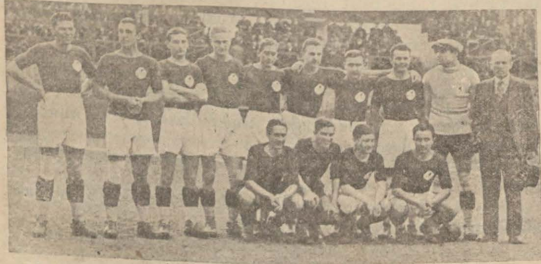
Yarın Fenerle karşılaşacak Yugoslavya takımı

Şilt maçı ve atletizm müsabakaları da yapılacak