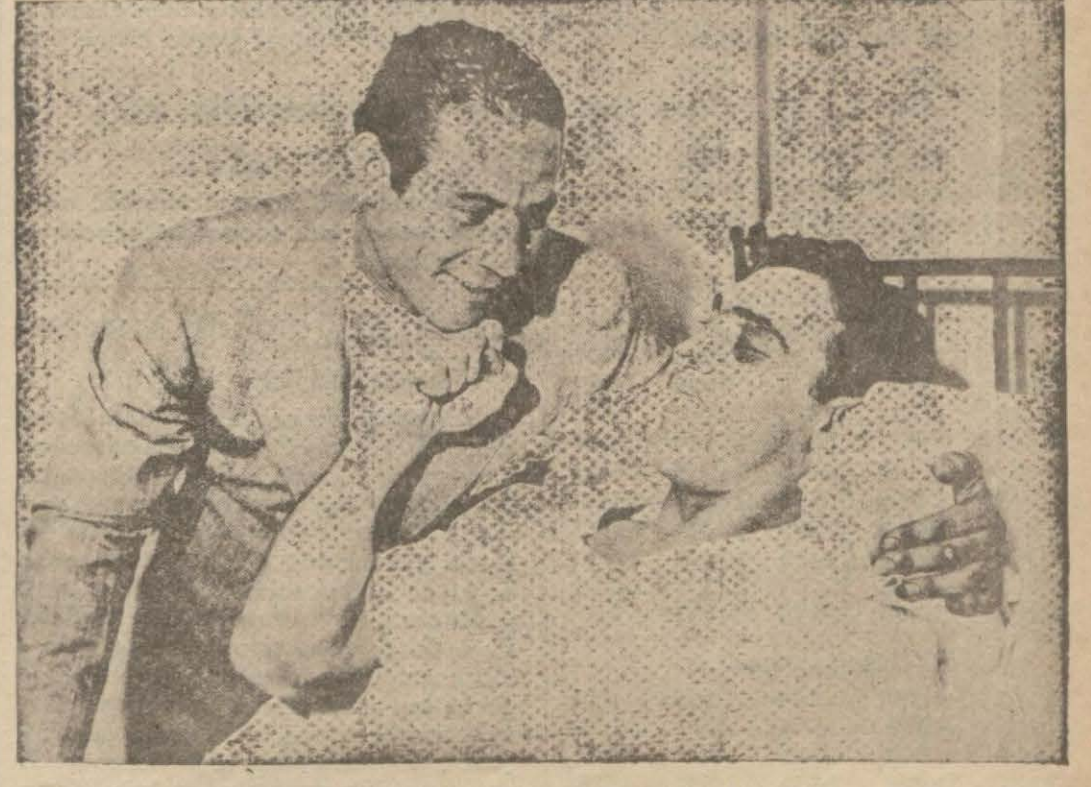
Dünya ağır siklet boks şampiyonluğunda yahudi Amerikalı boksör Baerden müthiş bir dayak yiyen İtalyan dev boksör Karnera hastahane yatmaktadır. Resimde görüleceği üzere yeni dünya şampiyonu Baer hastahane Karnerayı ziyaret etmiştir.

nen Beşiktaş - Galatasaray şild maçı da tekrarlanacak ve şehrimize Sofyadan gelen Balkan atletlerle atletlerimiz arasında müsabakalar yapılacaktır.