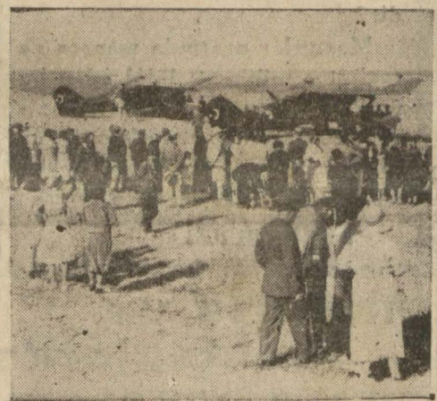
Dün isim takılan üç tayyarelerden ikisi alınan şu üç tayyareye bugün (Beyoğlu), (Üsküdar) ve (Adalar) isimlerini takmak münasebetile burada toplanan muhterem heyeti ve bütün İstanbul halkını Tayyare Cemiyeti namına minnet ve şükranla selamlarım.

İşte bugün bu vatani ve milli vazifenin mühim bir kısmının daha yapıldığını memnuniyetle görüyoruz. Vatan müdafaasının ehemmiyet ve kutsiyetini çok iyi takdir eden fedakâr İstanbul halkının kıymetli teberruatile üçüncü defa olarak satın