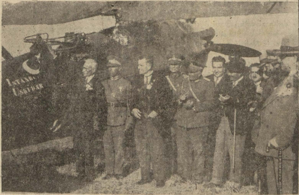
Tayyarelere isim konma merasiminden bir intiba: Üsküdar tayyaresi

İstanbul halkının teberruile orduya hediye edilen üç tayyarenin atkonma merasimi dün Yeşilköy'de binlerce halk huzurunda icra edilmiştir.