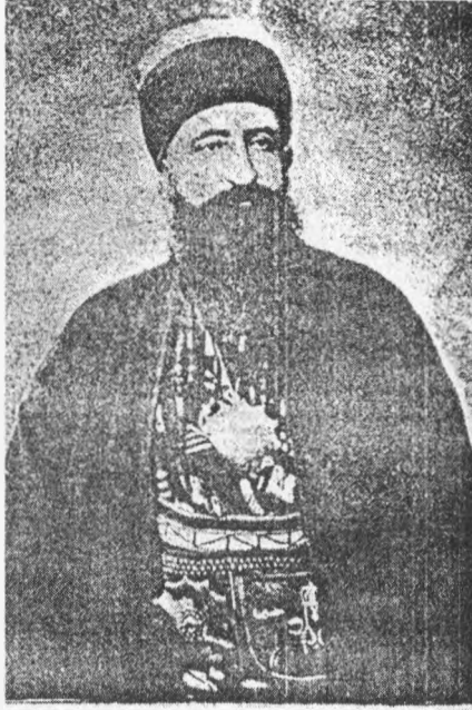
تساباده دور نالی درکاهی پوست اشقی قلهلی احمد مهدی بابا

muamele olunmaması husûsuna hırf u sây ve mukadderât eylemek bâbında fermân-ı âlişân-ı sâdır olmuştur.[107]