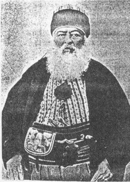
طریقت علیہ بکناشیہ بابا کاندن مرحوم حافظ نوری بابا

Bizde fesâd-ı dînî men için vâki olacak taarruzâta mukâbele etmek isteyen, beyne’l-müslimin zuhûr edecek fitne ve ifsâdâtı kaldıracak zevâtın çalışmasını istiksâr değil belki alkışlarız. [135]