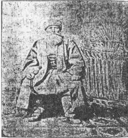
طرقه علیہ بکتاشیہ بابا کاندن و شمرای پانندن مصطفیٰ یساری بابا مرحوم

Tarikat-ı aliyye-i Bektâşiye altı yüz seneden beri bu vatan-ı muazzezde âyin ve erkânını tağmîm ve icrâ ile meşgûl olup 1296 senesine yani Hoca İshak Efendi'nin Kâşifü'l-Esrâr Dâfiu'l-Eşrâr isimindeki telif-i reddiyesinin neşrine kadar hiçbir taraftan bir itiraza , bir redde uğramamışken ve Hacı Bektâş-ı Velî Hazretleri'nin zamanından 1296 senesine kadar belki Hoca Efendi'den daha ziyâde âlim, tarikat hakkında daha ziyâde sâhib-i tettebbu ve tedkîk [151] ulemâ-yı kirâm ve fuzalâ-yı benâm varken, öteye beriye itirazla, hücûm ile şöhret bulan Hoca merhûmun böyle nâ-hak, bî-pervâ bir hareketle reddiye yazması pek ziyâde şâyân-ı taacüptür.