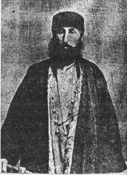
ایامیچده کائن بکتاشی درگاه شریفی پوسٹ نشینی نوری بابا زاده علی نطقی بابا افندی

di bize elde bulunan vesâik –i muhakkıkaya istinaden tarikatın Pîr-i Hünkâr Hacı Bektâş-ı Velî [6]