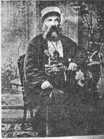
مردیوز کورینده کی شاه قولى سلطان درگاه شريفك پوست نشین عاشرى احمد برهان الله بابا ائندسك تصويريدر .

birçok eş'ar-ı ber güzîde meydana getirmiştir ki, bu gün taklîdi, tan-zîri gayri kâbil bir mertebededir. Nesîmi, bu suretle [39] diyar diyar gezerek Haleb'e gelir. Birâderi Şah-ı Handan'a gönderdiği mektupta kullandığı lisanı ve bil-hassa divânında bulunan eş'ar-ı vahdet-gûyesi, ulemâ-yı zâhirece mûcib-i töhmet addolunarak katline fetva verilir. Ve siyasetgâha götürülürken müftü der ki: 'Bu adamın kanı murdardır...her kimin bir uzvuna dokunursa o uzvu kesmek lâzımdır.' siyasetgah'ta müftü bu sözü yine takrîr ederken uzattığı eline derisi yüzülen Nesîmî'nin kanı sıçrar. Müftünün eli, hûn-i şehîd ile mihnâ olur. Bu sırada erbâb-ı dilden biri müftüye der ki: