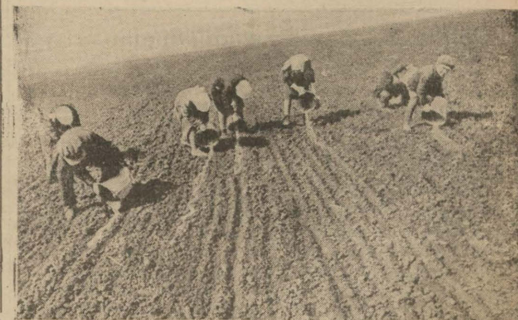
(B. Fuad Umay'ın Köylülerimizin kalkınması ile alakadar projesi hakkındaki yazısı altıncı sayfamızda okunuyor.)