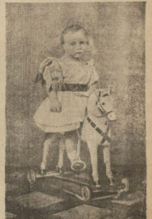
İmparator İkinci Vilhelm'in çocukluğu ("Çemberleyn'in hatıraları" telrikamız dördüncü sayfadadır.)

Adisababa, 18 (A.A.) — Habes resmi mahfilleri, Ras Desta kuvvetlerinin Dolo civarında geri çekilmeye mecbur edildiği ve habes ölümlerinin dört bin kadar olduğu habesini yalanlamaktadır. Resmî mahfiller, general Graziani'nin ilerlediği bölgede ancak bir kaç habes müfrezesi bulunduğunu da ilave eylemektedirler.