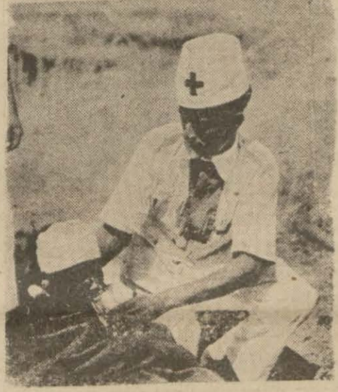
Harrar'da habes yaralularına bakılırken

b - Aynî muharebede ölen 4 milis askeri, tamamen çıplak bir halde bırakılmıştır. Bunların elbiseleri ve üzerlerinde bulunan her şey alınmıştır. Baştan başa çamurlanmış olan vücutları ilk bakışta ayırd edilemiyordu. Çünkü habesler, bunları Kalimino sularına atıp bırakmışlardır.