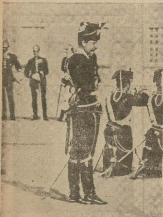
Çemberleyn'in mahmuzlarından bahsettiği İmparator İkinci Vilhelm