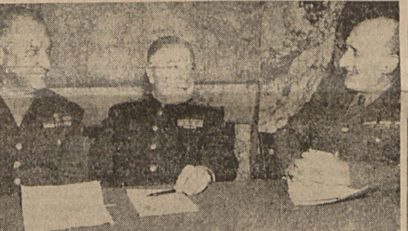
Macaristandaki Müttefik kontrol heyeti

Washington'da çıkarılan bir tebliğde Rus işgal ordusu, Macaristandaki hercümerce sebebiyet vermeye suçlandırılıyor