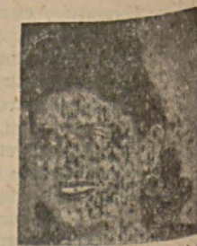
Bülbül sesli sanatkar