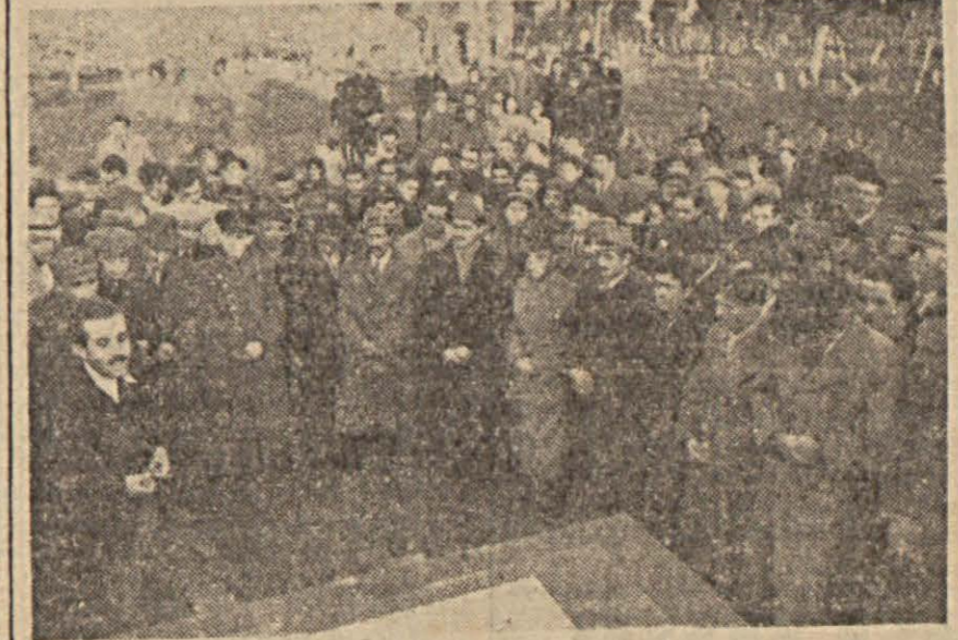
Gençler Akif'in mezarı başında