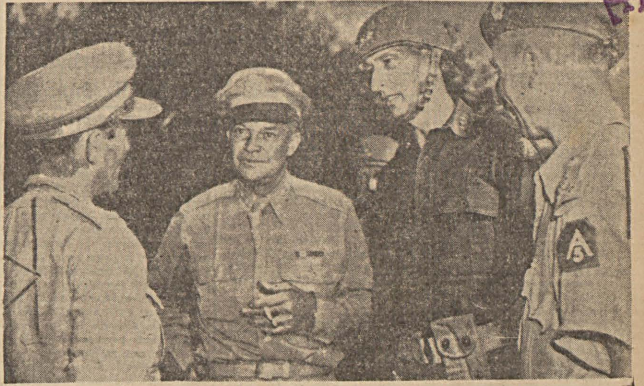
Batı Avrupaya yapılacak bildirilen büyük ihrac kuvvetlerine baskımandan tayin edilen General Eisenhower, İngiliz generallerle görüşüyor