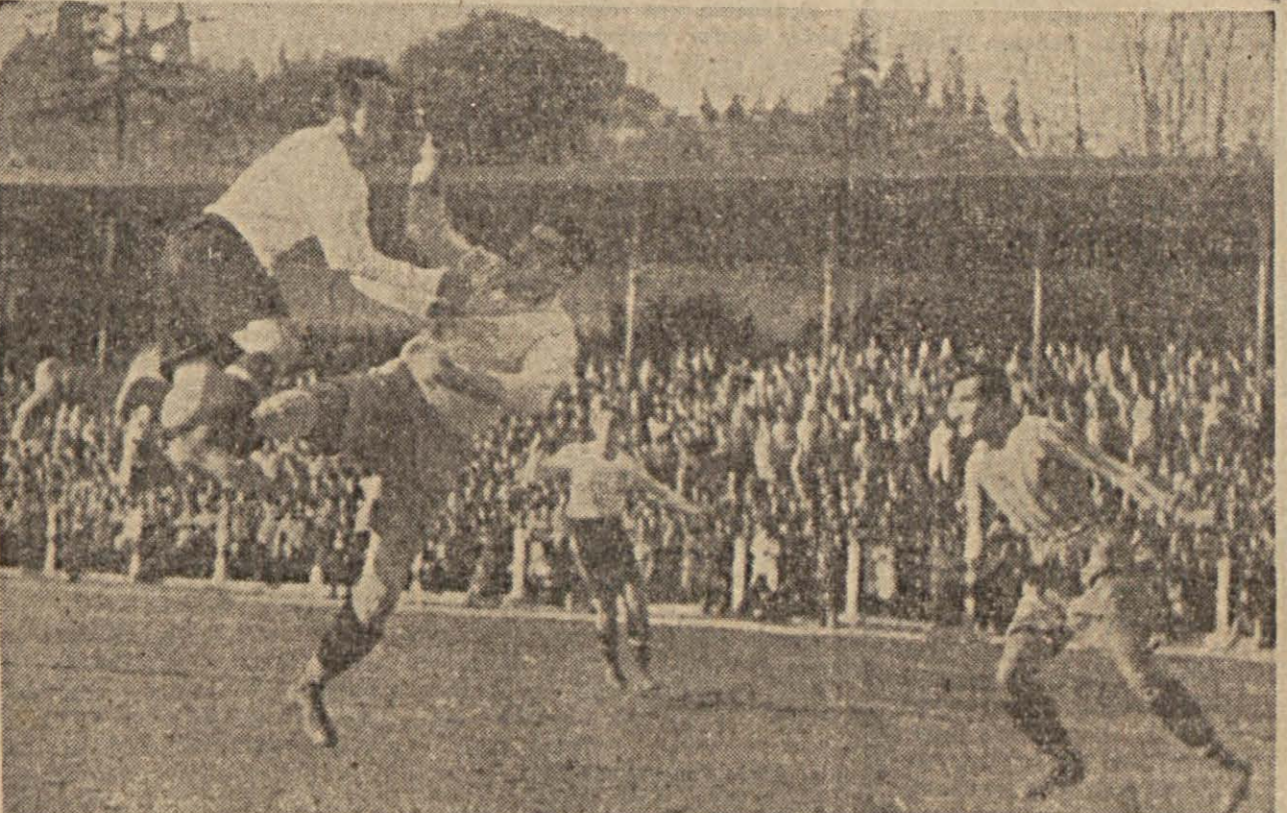
Galatasaray - Beşiktaş takımları arasında dün yapılan müsabakadan horaretili bir sahne (Dünkü spor hareketlerinin teşviki 2 nci sahifemizdedir.)