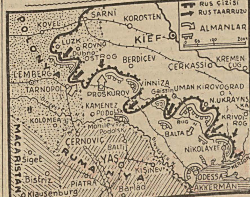
Sark cephesinin cenub kesiminde vaziyet — Yazısı 3 üncü sahifemizde —