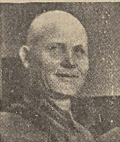
Rusların ikinci Ukrayna cephesi komandanı Mareşal Konief

Sovyetler Dniester kıyılarına vardıklarını resmen bildiriyorlar Moskova, altıncı Alman ordusunun ikinci defa imha olduğunu iddia ediyor