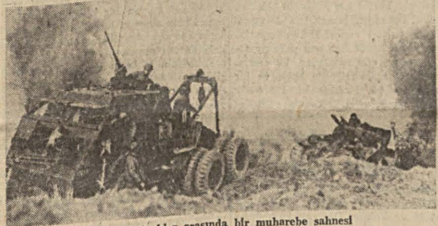
İtalyada tanklar arasında bir muharebe sahnesi

İtalyada beşinci ordu cephesinde yapılan uzun ve korkunç meydan muharebesinin sonu gözüktü