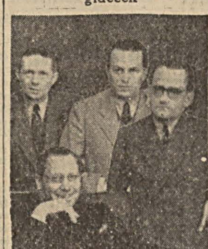
Macar ticaret heyeti azaları

Macaristandan gelen heyet de yarın akşam Ankara'ya gidecek