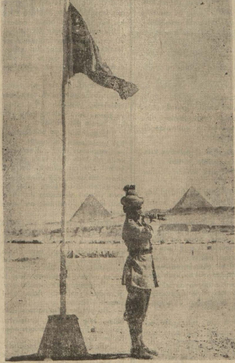
Bugünkü kalî muharebelere sahne olacağı anlaşılan Mısır topraklarından bir görünüş

Londra 18 (a.a.) — Rusyada bulunan Polonya ordusunun Ortasarka naklinin tamamlanması mü-nasebetile Polonya Başkomutanı General Sikorskiye General Andreden gelen telgrafta, Ortasarktaki bütün Polonya ordusunun şimdi birleşmiş olarak bu harp alanındaki müttefik kuvvetlere dahil bulunduğunu bildiriliyor.