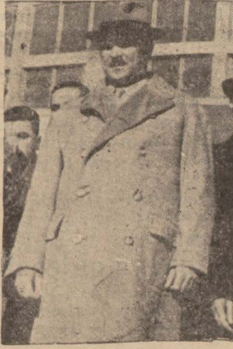
Ay sonunda Romada bulunacağı bildirilen dost ve mütefak Yugoslavyanın kıymetli Başvekil Stoyadinoviç'in şehrimizi ziyareti esnasında alınan resimlerinden biri

Varşova, 17 (A.A.) — Lehistan ajansı, İtalya ile Romanya arasında bir dostluk muahedesi için müzakerelerin başladığını ve Romanya-