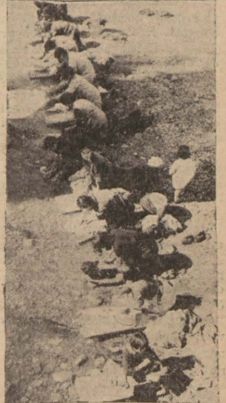
Gençler cepheye varurken ihtiyar İspangol kadınları da askerlerin çamaşırlarını yıkıyorlar

Londra 17 (A.A.) — Millî İngiliz hükümeti lehinde yapılan bir nümayış esnasında Sir John Simon, İngiliz hükümetinin İspanyol dahilî harbine müdahale etmek isteme-